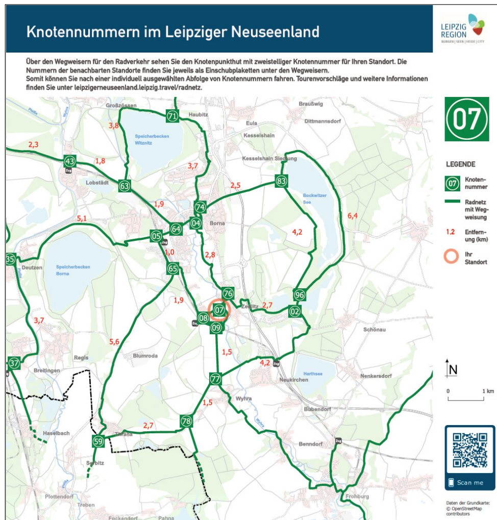
Abbildung 4.1 Beispiel für eine kleine Knotennummerninformationstafel (hier: Standort 07)

Dargestellt werden auf den Tafeln eine kurze textliche Erläuterung des Knotennummernsystems, eine Kennzeichnung des eigenen Standorts, ein QR-Code, der auf die angegebene Website weist sowie eine einfache Legende zur Karte (Abbildung 4.1). Angestrebt wurde eine weitestgehende Anlehnung der Gestaltung an die Vorgaben des Touristischen Informations- und Leitsystems der Leipzig Region /5/. Die Entwürfe für alle Tafeln sind in Fehler! Verweisquelle konnte nicht gefunden werden. zu finden. Die übergebenen Dateien wurden in einer Auflösung von 300 dpi erstellt.